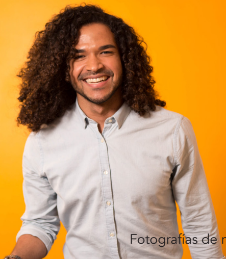
Fotografías de modelos.

Si usted es elegible para el plan, sus hijos dependientes también pueden inscribirse.